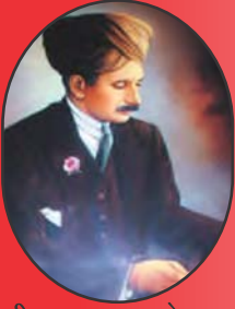
दीन बन्धु सर छोटूराम