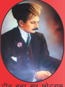
दीन बन्धु सर छोटूराम